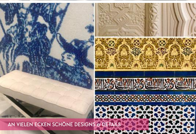
AN VIELEN ECKEN SCHÖNE DESIGNS & DETAILS