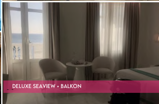
DELUXE SEAVIEW + BALKON