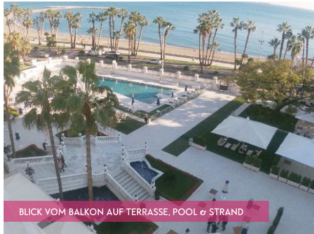
BLICK VOM BALKON AUF TERRASSE, POOL & STRAND