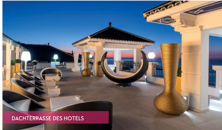
DACHTERRASSE DES HOTELS