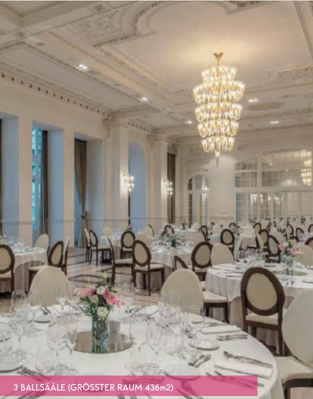
3 BALLSÄLE (GRÖSSTER RAUM 436m2)