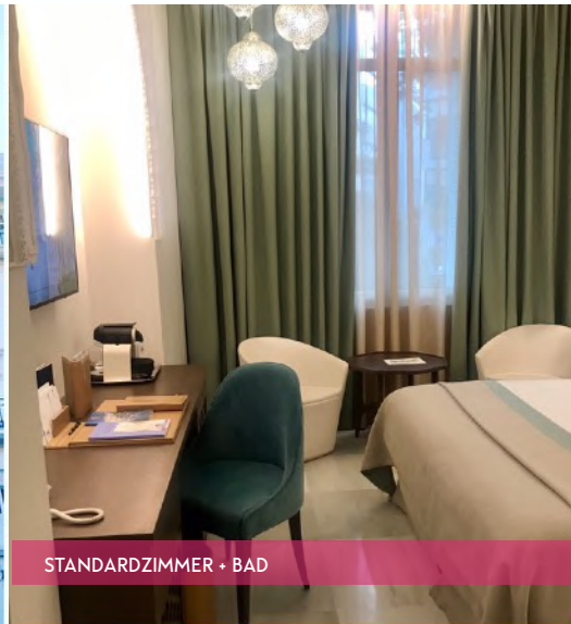
STANDARDZIMMER + BAD