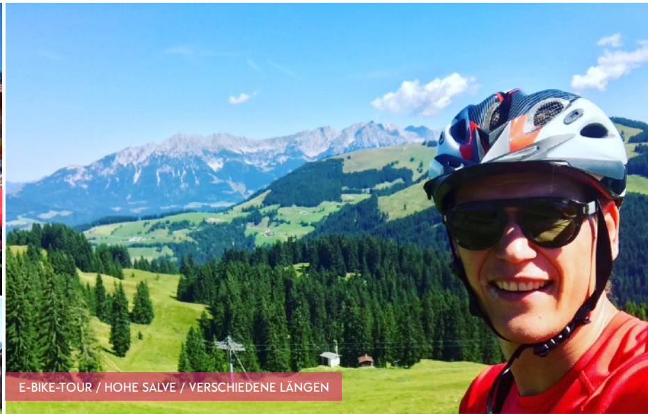
E-BIKE-TOUR / HOHE SALVE / VERSCHIEDENE LÄNGEN