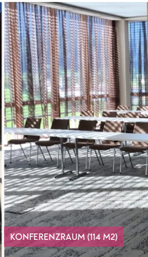
KONFERENZRAUM (114 M2)