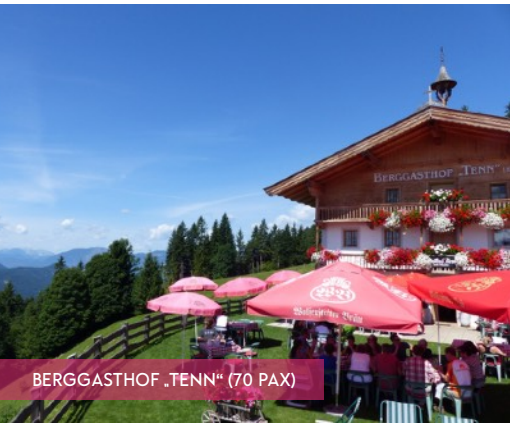
BERGGASTHOF „TENN“ (70 PAX)