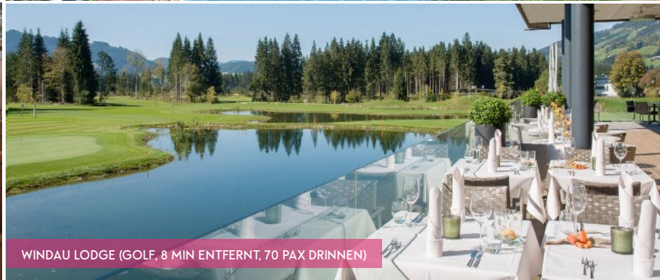
WINDAU LODGE (GOLF, 8 MIN ENTFERNT, 70 PAX DRINNEN)