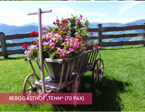
BERGGASTHOF „TENN“ (70 PAX)