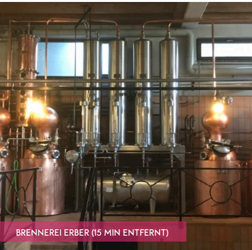
BRENNEREI ERBER (15 MIN ENTFERNT)