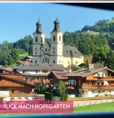
BLICK NACH HOPFGARTEN